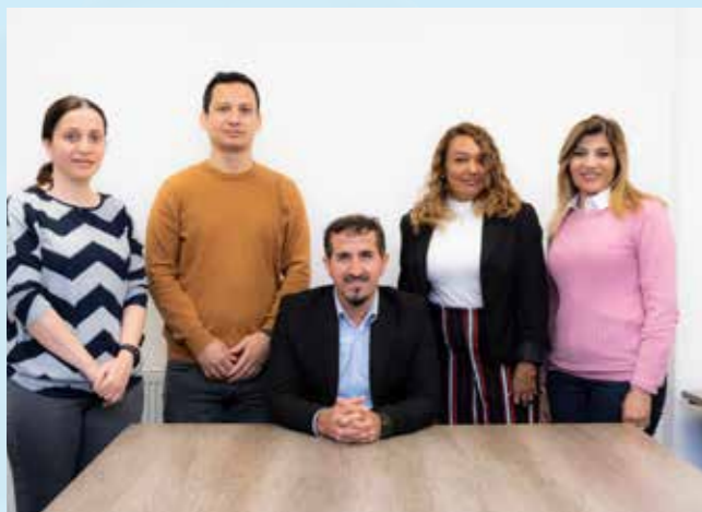
Tim Symud Ymlaen WRC

Mae ffoaduriaid sydd newydd gael caniatâd yn cael 28 diwrnod yn unig i gynllunio eu symud o'r llety lloches cyn iddynt wynebu cael eu troi allan. Mae hyn yn gadael pobl yn agored iawn i ddiweithdra, digartrefedd a thlodi eithafol. Eleni