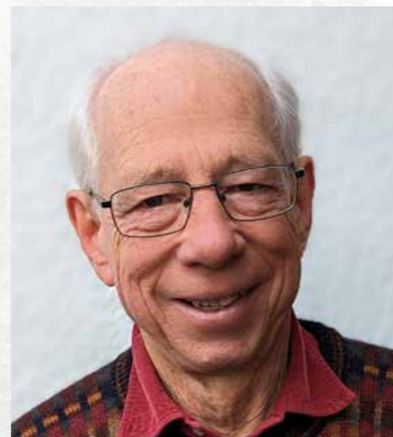
Mae'n bleser gennyf gyhoeddi'r adroddiad hwn sy'n arddangos blwyddyn o lwyddiannau sylweddol yn wyneb heriau go iawn.

Fe wnaethom ddatblygu ffyrdd newydd o gefnogi ceiswyr lloches a ffoaduriaid wrth i Gymru ddod allan o'r pandemig Covid, gan gyflwyno 5,700 o sesiynau i gleientiaid sy'n siarad 40 o ieithoedd gwahanol o 50 o genedloedd gwahanol. Mae ein cymorth yn aml ar adegau o argyfwng, gan helpu pobl i oresgyn heriau sy'n ymwneud â thai, cyllid, iechyd, addysg a chyflogaeth. Diolch arbennig i'n gweithwyr achos am eu gwaith diflino a'u hymroddiad.