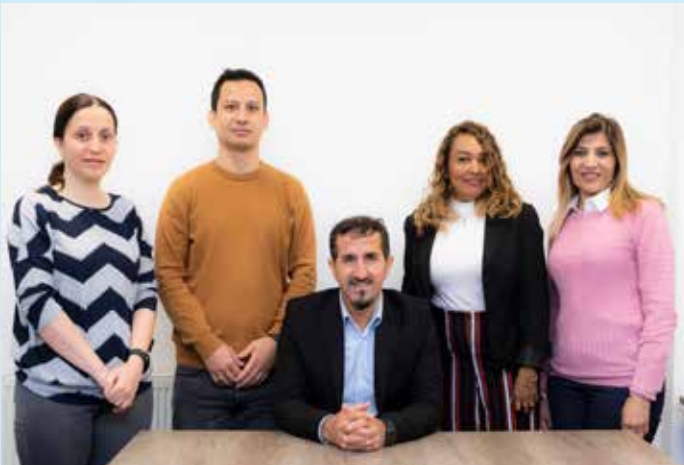
The WRC Move On team

Newly granted refugees get just 28 days to plan their move on from the asylum accommodation before they face eviction. This leaves people highly vulnerable to unemployment, homelessness, and extreme poverty.