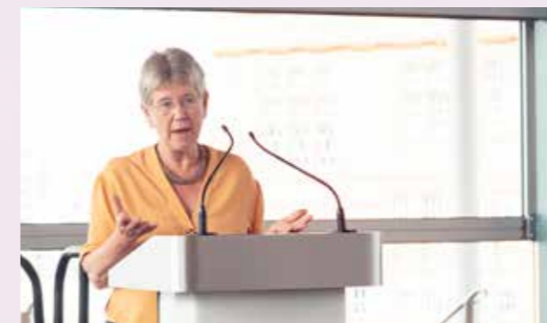
Jane Hutt - Minister for Social Justice

Rhan allweddol o'n gwaith yw dylanwadu ar randdeiliaid a swyddogion etholedig, i weithredu polisiau mwy trugarog ar gyfer ceiswyr lloches a ffoaduriaid.